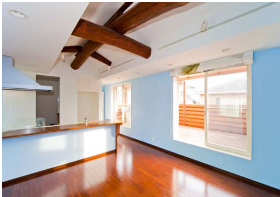
2階・子世帯のキッチン。対面のカウンター式という希望を予算内でかなえるために、キッチン設備は壁付け用を選択。背パネルの部分は造作で補った。