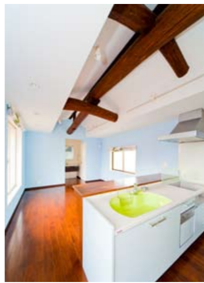
2階・子世帯リビング。解体中に現れた梁が立派だったので、これを生かすことを担当者から提案。新築では真似のできないデザイン設計が可能となった。

よう、同社がもっとも力を入れていることが人材教育だ。同社では、一人ひとりに社会的責任の意識を持ってもらうためにコンプライアンス研修を必須とし、さらに営業・職人・施工管理・サービスなど、それぞれの分野に応じた研修体制を整備。外部セミナーや特別セミナーを毎月行い、スキルアップを